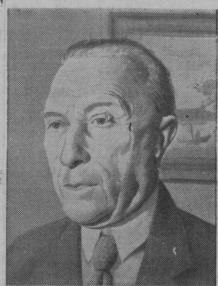
El canciller Adenauer

Bonn, 20.—El canciller Konrad Adenauer ha pronunciado en la Cámara Baja del Parlamento alemán un discurso de una hora y media de duración, en el que ha declarado los propósitos de su Gobierno en todos los aspectos.