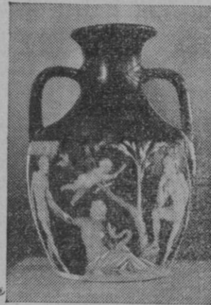
El famoso jarrón de Portland, que hace un siglo fué roto en el Museo británico, ha sufrido ahora una segunda restauración. Esta joya data del año 69 antes de Jesucristo, y es de cristal oscuro con bajo-relieves en cristal blanco opaco