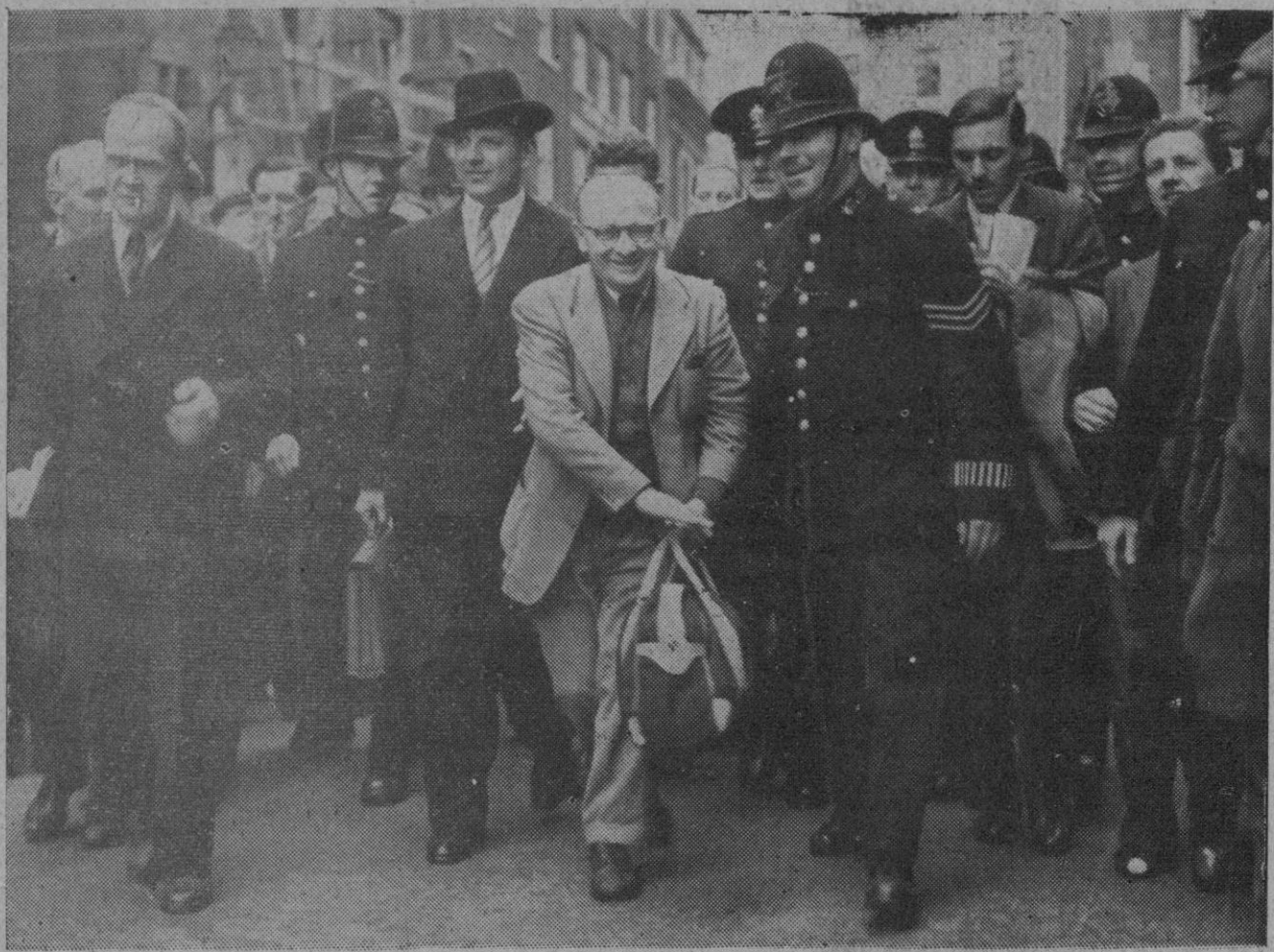
Gerhard Eisler, comunista alemán huido de los Estados Unidos, fue detenido, como es sabido, a su llegada a Londres, pero los jueces ingleses denegaron la petición norteamericana de extradición. En la foto aparece esa ficha roja cuando, ya en libertad y alegremente escoltado, se dirige al aeropuerto con su bolsa de viaje para trasladarse a la zona soviética de Alemania

LUCE EN LA SOLAPA EL DISTINTIVO DE LAS BRIGADAS INTERNACIONALES QUE LUCHARON CON LOS ROJOS ESPAÑOLES