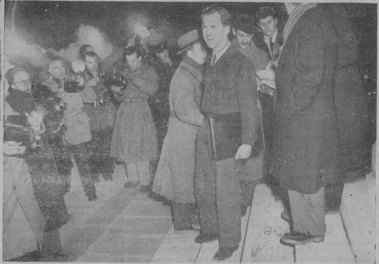
No crean ustedes, después de pasar su vista sobre la fotografía, que ésta refleja algún sensacional acontecimiento, de trascendencia decisiva para el mundo tan dramáticamente conmovido por múltiples y graves sucesos. Ese despliegue de fotógrafos, operadores de cine y reporteros de Prensa ha sido realizado con motivo de la audiencia concedida por el Presidente de la República francesa, M. Auriol, al llamado "ciudadano del mundo", Garry Davis, que después de su ya larga permanencia en los alrededores de la sede de la O. N. U. en París, continúa acaparando las primeras páginas de los diarios... de Francia. Ahí le tienen ustedes, provisto de una cartera "ministerial", posando tranquilamente para "la posteridad". El dice que en 1950 convocará unas elecciones generales en todo el mundo para la constitución de un Parlamento mundial...

LIBROS, REVISTAS, TRABAJOS COMERCIALES, IMPRESOS DE LARGA TIRADA, encárguelos en