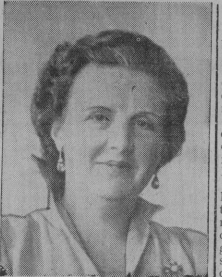
La Reina Juliana

Espera que se forme en breve un Gobierno federal indonésico