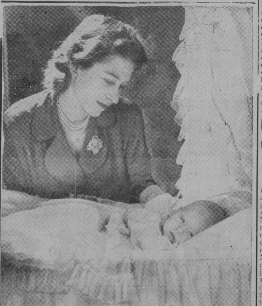
Nuestra "foto", tomada en el Palacio de Ruckingham, muestra a la Princesa Elizabeth con su hijo el Príncipe Carlos Felipe Arturo Jorge, que acaba de cumplir cuatro semanas de edad