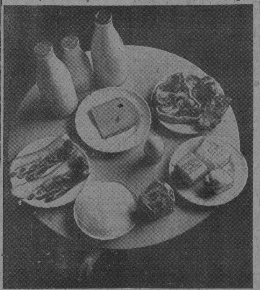
Esto que parece el cuadro pictórico de un bodegón, es una fotografía que da a conocer en qué consiste la ración alimenticia semanal de un súbdito británico: Cada persona percibe, pues, en la Gran Bretaña, cada ocho días, 57 gramos de bacalao, 225 de azúcar, 57 de té, 28 de mantequilla de cerdo, 84 de margarina, un huevo, 28 gramos de queso, un litro y medio de leche y un trozo pequeño de buey salado.