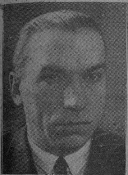
André Marie, que ha recibido el encargo de formar Gobierno "a toda costa"

Es difícil conciliar a los socialistas y a los derechistas