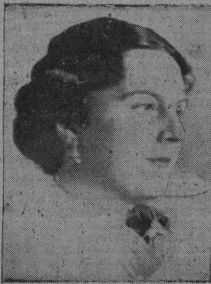
La Reina Juliana

La ex Reina Guillermina estampó su firma poniendo así fin a su largo reinado