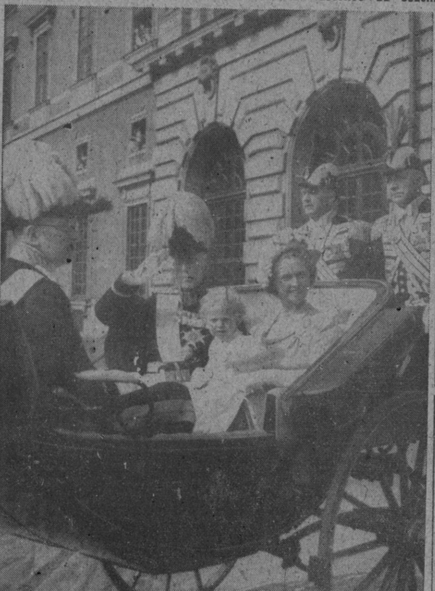
Esta fotografía está tomada el día en que celebró el noventa aniversario de su natalicio, el Rey Gustavo V de Suecia. En ella aparecen, ocupando el coche Real, a la izquierda, el soberano sueco y, a la derecha, de éste la princesa Sibylla que muestra en sus rodillas a su hijo el príncipe Gustavo Adolfo. En primer plano, a la izquierda, se halla el esposo de dicha princesa y heredero del trono, Carlos Gustavo