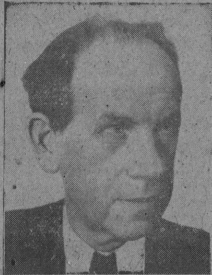
Antonín Zapotocký, presidente del Consejo de ministros de Checoslovaquia, sucesor de Clement Gottwald

La manifestación fué disuelta por la Policía, con porras