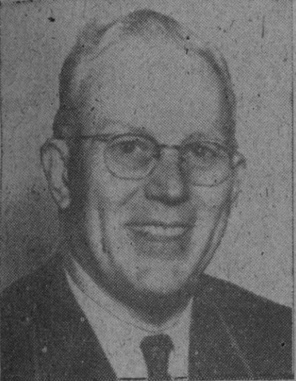
Earl Warren, gobernador de California, a quien se considera futuro vicepresidente de los Estados Unidos