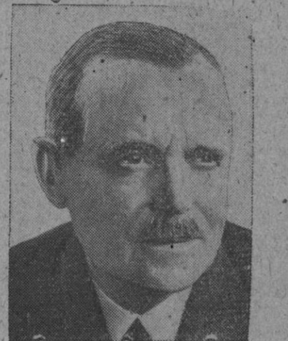
Louis St. Laurent, ministro de Asuntos Exteriores del Canadá