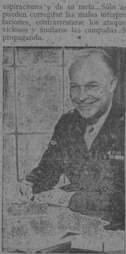
El general Eisenhower

«El derrotar a las democracias unidas en una común defensa, sería formidable tarea para cualquier potencia. En caso de guerra próxima, ejerceríamos el control casi completo de dos océanos; controlaríamos las rutas aéreas transoceánicas mediante la posesión de bases que muchos años serían necesarias para un tráfico aéreo sostenido tanto pacífico como de carácter bélico», agrega, abogando, por último, porque se difunda el conocimiento de Norteamérica y de los objetivos norteamericanos. «Nada tenemos que ocultar—dice—y, por consiguiente, sólo podemos ganar con que se esparza el conocimiento de nuestro país, de sus móviles, de sus aspiraciones y de su meta. Sólo así pueden corregirse las malas interpretaciones, contrarrestarse los ataques viciosos y anularse las campañas de propaganda.»