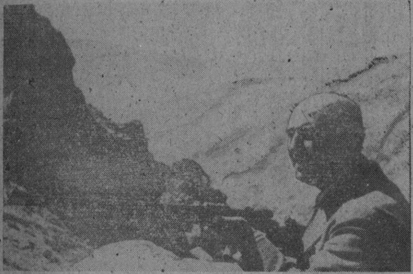
Su Excelencia el Jefe del Estado, fotografiado en un puesto de caza durante una cacería en Gredos

Han sido remitidos al gobernador civil en nombre de S. E. y de su esposa