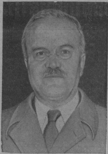
Molotov, cuya declaración de ayer acerca de la bomba atómica ha causado sensación, no tanto por la posibilidad de que los soviets conozcan el secreto de fabricación de aquélla—en lo que generalmente se expresa escepticismo—sino por su deliberado propósito alarmista y político en provecho de los designios de la Unión Soviética

«El ejército rojo está armado con arreglo a la última técnica militar» Londres, 7 (5 t.)—El mariscal so-