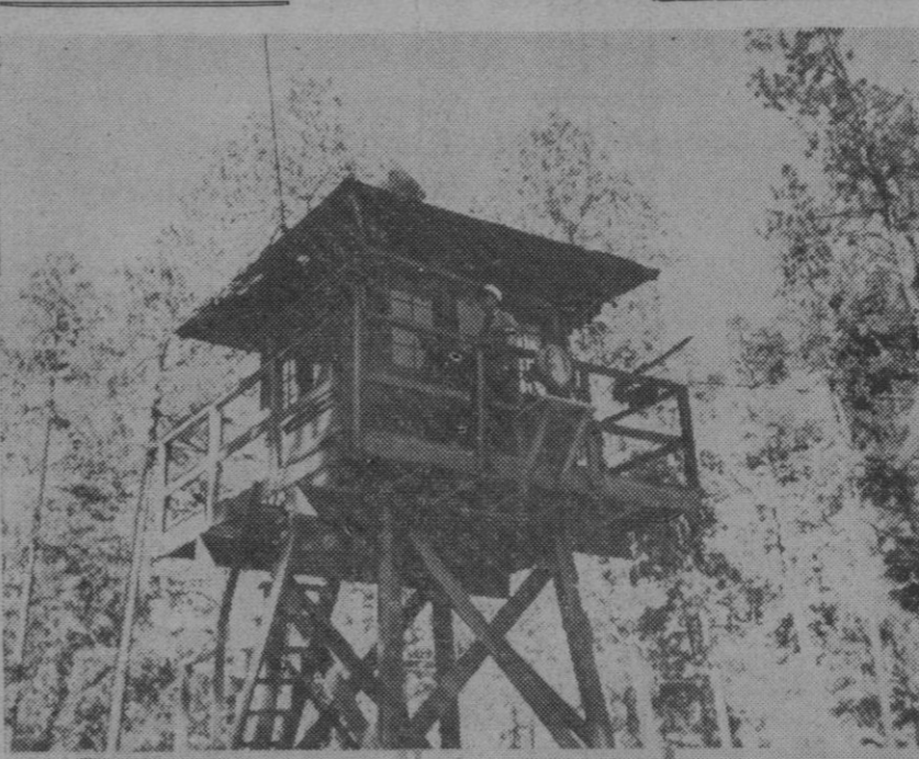
Las fotografías que publicamos son las primeras que se hicieron de la villa de Los Alamos (Nuevo Méjico), fundada en 1942 y convertida en una fortaleza. Allí, como es sabido, se trabaja febrilmente en la construcción de bombas atómicas, hallándose ocupados en estas labores científicas los mejores sabios del mundo. La foto superior muestra una torre de la villa, dotada de ametralladoras, reflectores y antenas de radio. En la foto inferior vemos la entrada al llamado cuartel general de la fábrica fortaleza

«COMBAT» DICE QUE RUSIA TRATA DE CREAR LA ATMOSFERA QUE DESEA