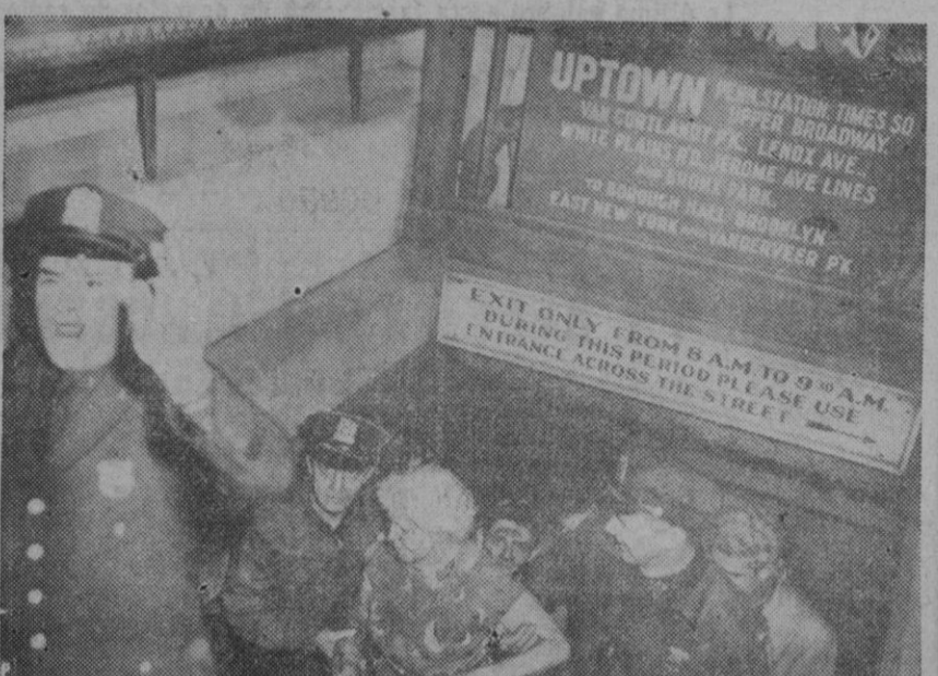
Más de dos mil personas, embanastadas como sardinas en el "metro" de Nueva York, se creen perdidas cuando el tren que las conduce se detiene bruscamente, durante más de una hora, debajo de East River, como si acabara de originarse un percance. Cuando, al fin, el convoy reanuda su marcha y llega a la estación de Wall Street, muchos de los viajeros se hallan en un estado de inconsciencia y bastantes padecen fuertes ataques de nervios. La fotografía recoge el momento en que una mujer que sufrió tres choques de trenes, es ayudada por la Policía a subir la escalera del subterráneo