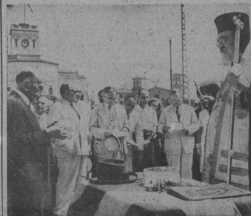
Llegan a Grecia los primeros cargamentos de productos alimenticios norteamericanos. Con tal motivo, el ex presidente del Consejo helénico, Máximos (a la izquierda), da las gracias, leyendo unas cuartillas, al embajador de los Estados Unidos en Atenas, Mr. Lincoln Mac Veight (a la derecha), que le contesta en la misma forma. Luego, el arzobispo de Atenas, Damaskinos, reza un Te Deum, bendiciendo después a los primeros sacos de harina enviados y rociando con agua bendita una cantidad de aquella, colocada, en un recipiente, sobre una mesa