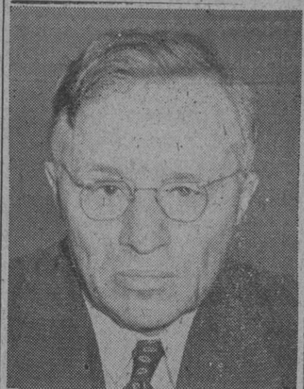
El ministro de Agricultura del Canadá, James Gardiner, que asiste, en representación de su país, a las negociaciones de la F. A. O., en Génova