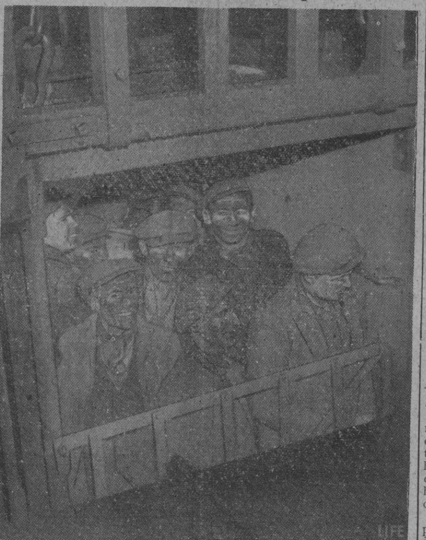
A pesar de los deseos del Gobierno británico de que los obreros de las minas carboníferas trabajen medio día más a la semana, con objeto de obtener un rendimiento mayor hasta lograr extraer doce millones de toneladas de carbón sobre las que ahora se producen, los obreros, lejos de obedecer a las insistentes demandas del Gobierno británico, han declarado huelgas que, continuamente, se extienden. En la fotografía vemos a un grupo de mineros al abandonar el trabajo por haberse declarado en huelga

El Congreso de Sindicatos apoya al Gobierno pero la situación tiende a agravarse