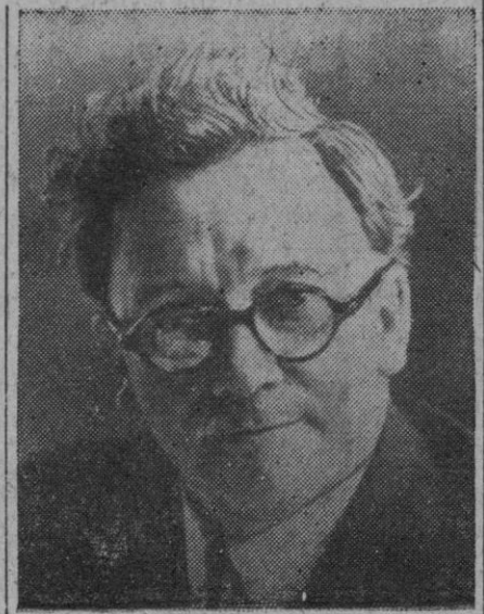
Herbert Morrison, presidente del Consejo británico

Estas pesetas son a modo de compensación de las que se dejaron de percibir por los ingresos habidos anteriormente en el partido que el equipo argentino jugó en Barcelona.—Logos.