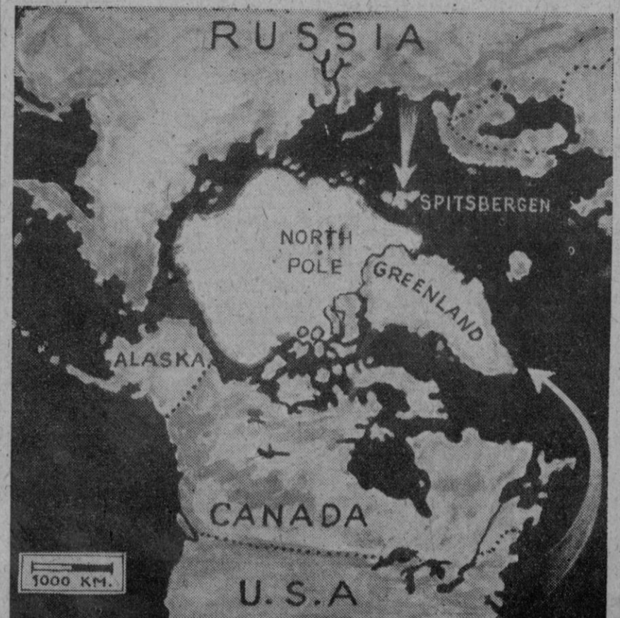
Como es sabido, la Unión Soviética aspira a poseer bases aeronáuticas y navales en la colonia danesa de Groenlandia. Rusia y Dinamarca han discutido la cuestión de la cesión de bases que, como puede verse en este mapa, publicado por una revista mensual americana, son de gran interés estratégico