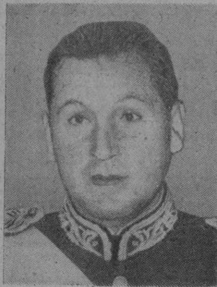
El Presidente de la Argentina, general Peron, que ha dirigido a España un emotivo mensaje por radio

“No acierto a expresar la intensidad de mi agradecimiento por el homenaje más gentil y caballeresco que pueblo alguno pudiera ofrecer a una dama”