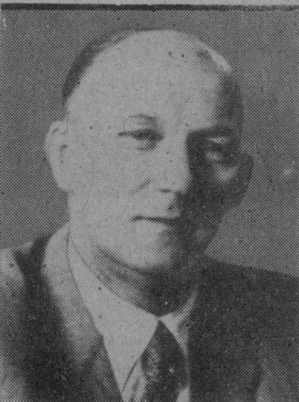
El general Lajos Dimnyes, que ha sucedido a M. Ferenc Nagy en la presidencia del Consejo de Hungría como consecuencia de la huida del segundo día antes de producirse el golpe de Estado comunista