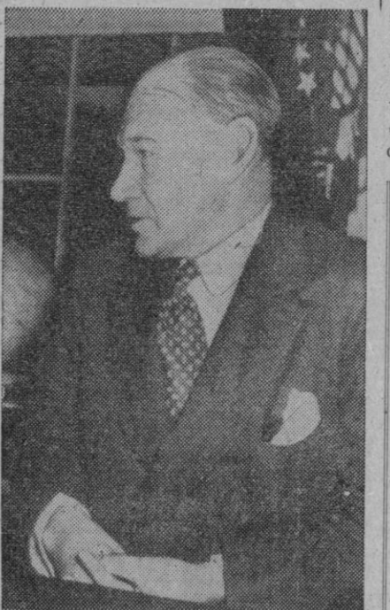
M. Lewis Douglas, nuevo embajador de los Estados Unidos en Londres