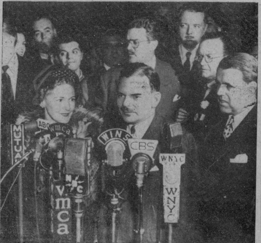
M. Thomas E. Dewey, gobernador de Nueva York, pronunciando un discurso por radio durante su campaña electoral. En la fotografía aparece también la señora de Dewey

Wibwny (Nueva York), 19 (6 t.)—La legislatura del Estado ha concedido un voto de confianza al gobernador Thomas E. Dewey, lo que se considera que refuerza sus perspectivas para la candidatura republicana a la Presidencia. Dewey ha conseguido libertad de acción para realizar su programa legislativo, incluyendo rigurosas leyes contra las huelgas, un plan de gastos de mil millones de dólares, impuestos especiales para el pago de las gratificaciones a los ex combatientes y aumento de salarios para los maestros de escuela.—Efe.