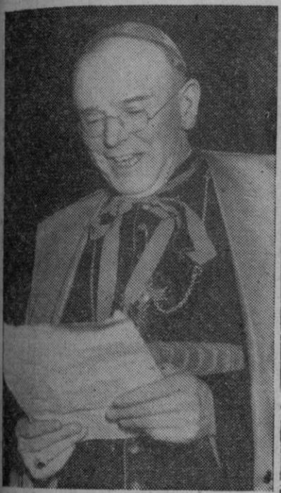
El cardenal Griffin

Birmingham, 19 (6 t.)—En una declaración pronunciada con motivo de la consagración del nuevo arzobispo de esta ciudad, el cardenal Griffin, arzobispo de Westminster se ha congratulado de la reciente declaración del Presidente Truman sobre Grecia y Turquía. La Carta del Atlántico, que hoy día no se atreven los hombres a mencionar, dijo el prelado, proclamaba unos principios básicos que en su mayor parte han sido por completo rechazados. En muchas naciones del Este de Europa el hombre no tiene libertad de acción ni de expresión, ni puede practicar su reli-