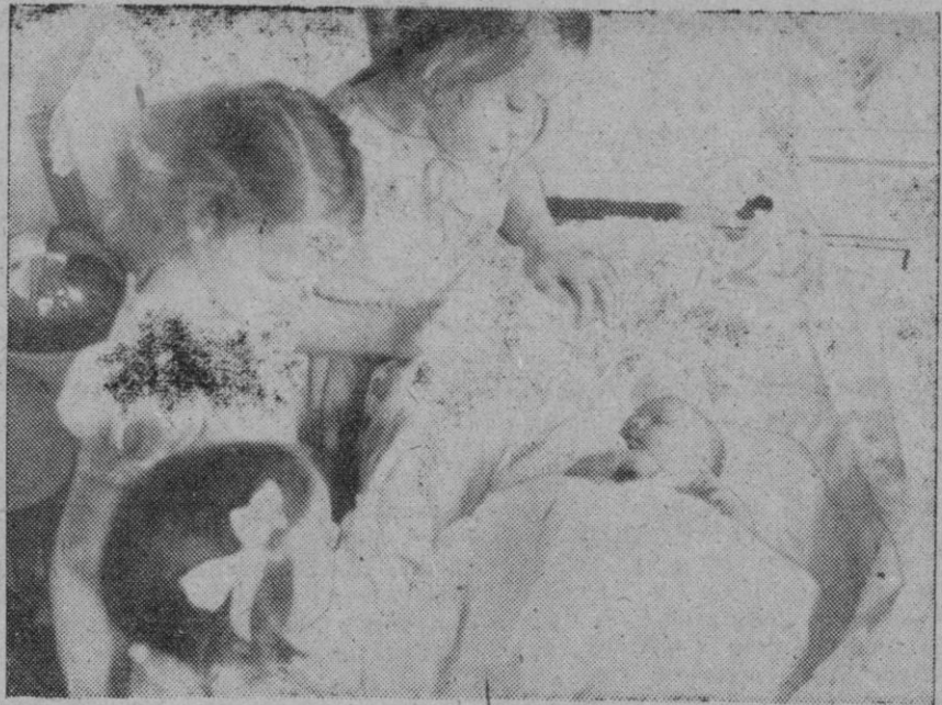
Las princesitas Beatriz, Irene y Margarita, de Holanda, recibieron alborozadamente la noticia de que una escala de ángeles habían dejado en un aposento del castillo de Soestdijk, donde ellas ven, felices, desfilando los días, otra princesita cuya aparición puso lágrimas de dicha en los ojos de la princesa Juliana, su madre, y heredera del Trono holandés. Y he aquí a Beatriz, Irene y Margarita contemplando con arrobamiento a su tierna y también bella hermanita—a la que se llamará María—que a su vez parece contemplarlas a ellas con dulce curiosidad