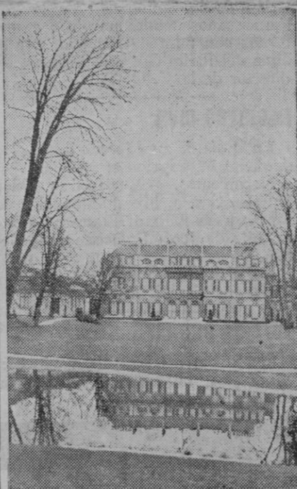
El palacio del Eliseo, residencia oficial del Presidente de la República

Poco después se retiraron Milán, 17 (7 t.).—Miembros del Movimiento fascista clandestino se apoderaron anoche de Radio Milán, aunque no consiguieron divulgar su propaganda. Dos hombres y una mujer enmascarados, pistola en mano, consiguieron el control de la emisora y encerraron en una habitación a los empleados. No obstante, uno de éstos cortó el circuito del micrófono. Dos de los asaltantes hablaron ante el micrófono sin saber que estaba desconectado. Después de retirarse los fascistas los empleados de la emisora avisaron a la Policía.—Efe.