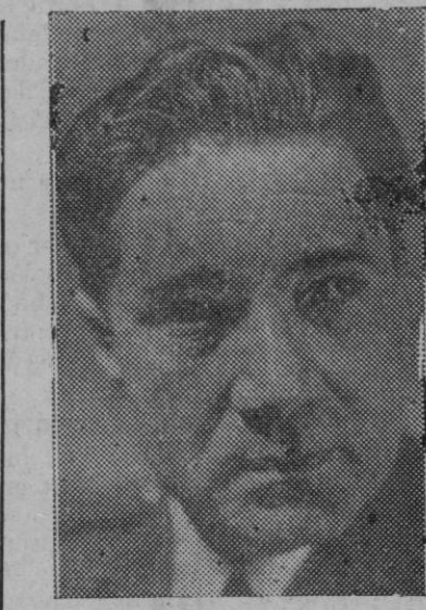
El ministro del Aire, general Gallarza

Añadió el general Gallarza: —En este año que acaba de terminar, España se ha incorporado a la red de comunicaciones aéreas mundiales. Con arreglo a los compromisos contraídos en Chicago, España ha enviado sus delegados a la O. P. A. C. I., tanto a las asambleas como a los comités técnicos. No hemos firmado las cinco libertades, sino solamente las dos primeras—acuerdos de tránsito—, cosa que, por otra parte,