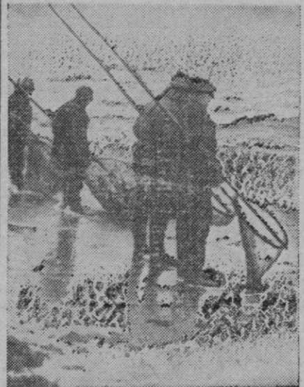
En ninguna parte del mundo se da el ámbur en cantidades tan grandes como en la costa alemana del mar Báltico, y por eso se la llama también la dorada Prusia oriental. Nuestra foto presenta los pescadores de ámbur con sus redes para la pesca