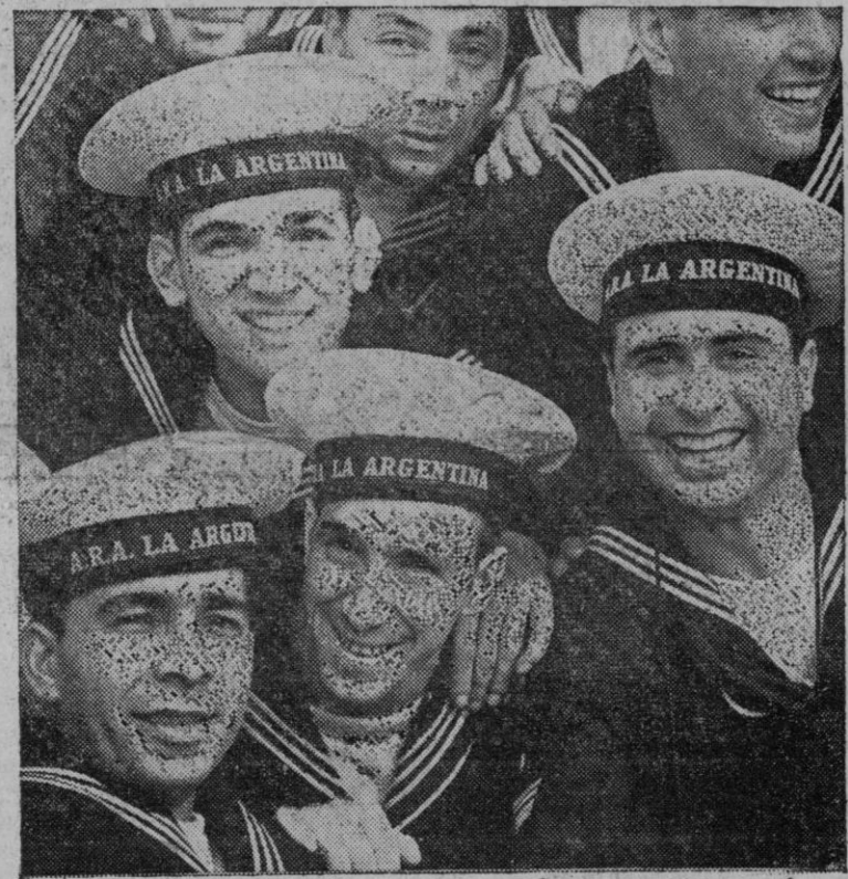
Durante la reciente visita de los marinos del crucero argentino a Madrid ha sido tomada esta fotografía de un grupo de tripulantes del "Argentina". En los rostros de todos ellos se advierte la alegría que les han producido las atenciones recibidas en su viaje por España