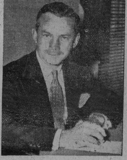
Forrestal, secretario de Marina norteamericano

White Oak (Maryland), 16 (5 t.).—El secretario de Marina norteamericano, Forrestal, ha declarado que los Estados Unidos deben vigilar la paz, estando preparados para la guerra hasta tanto que la organización de las Naciones Unidas haya experimentado su completo y total desarrollo. Los Estados Unidos no pueden persuadir a las demás naciones para entronizarlas en un Estado de paz, pero pueden, por sí mismas, hacer todo lo posible para evitar el ser atacadas. En ningún caso los Estados Unidos, antes de obtener sus intenciones de lograr la paz, deberán destruir su propia potencialidad de guerra. Por lo menos, nosotros no pensamos hacer esto.—Efe.