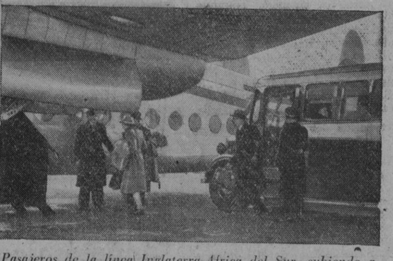
Pasajeros de la línea Inglaterra-Africa del Sur, subiendo a bordo del avión, en el aeródromo de Londres