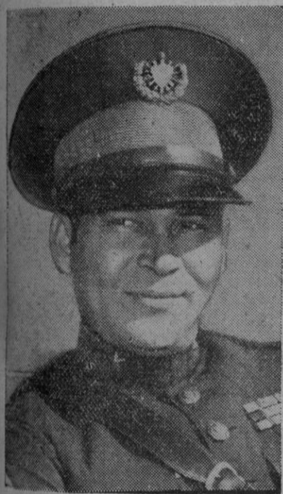
El ex Presidente de Cuba, coronel Batista

«Sombras de América» se titulará el libro que ha escrito