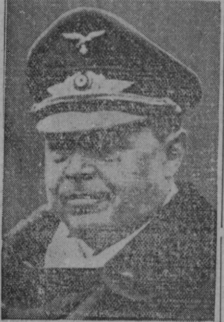
El mariscal Kesselring

Caserta, 15.—En el Cuartel general aliado se ha anunciado que el mariscal de campo von Kesselring será juzgado en Italia el próximo otoño como «criminal de guerra».