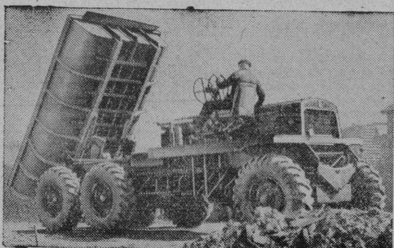
En Inglaterra se está utilizando en los trabajos de la reconstrucción un nuevo tipo de camión basculante, de siete metros cúbicos de capacidad. La principal novedad de este vehículo es la de marchar rápidamente por los caminos más rudimentarios