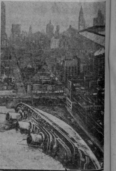
El gran trasatlántico que fué orgullo de Francia fotografiado en el puerto de Nueva York, cuando hace varios años se hundió de costado a consecuencia de un incendio. Después fué puesto a flote y utilizado por Estados Unidos en misiones de guerra

Actualmente se halla en dique seco en Brooklyn