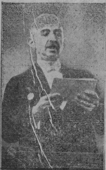
El presidente de Turquía, Inonu

Angora, 18 (5 t.).—El primer ministro, Inonu, en un discurso radiado que ha durado cuarenta minutos, relativo a las elecciones, ha dicho que Turquía mantiene un ejército como si fuera en tiempo de guerra... a pesar de su sincero deseo de ver implantarse una pronta y duradera paz para todas las naciones... La petición de que sean anexionadas a Rusia nuestras provincias orientales es cuestión que concierne a nuestra existencia e independencia nacionales. Turquía se enfrenta hoy con problemas que pueden llegar a ser tan vitales como los de 1938.—Efe.