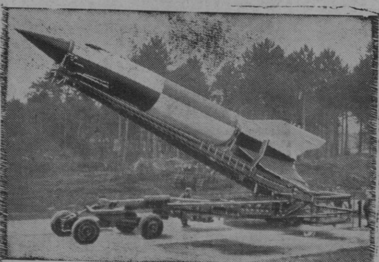
Los científicos británicos hacen experimentos con la bomba cohete, conocida por «V-2», en Cuxhaven (Alemania)