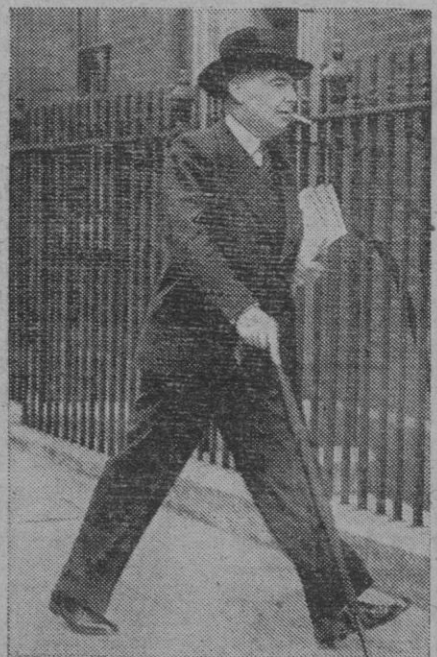
Hore Belisha, ex ministro de la Guerra inglés

«Sólo este partido podrá ofrecer una oposición eficaz al socialismo»