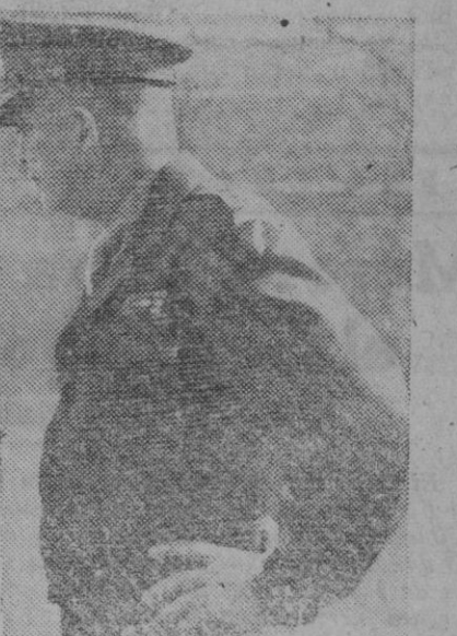
El general Eisenhower

Berlín, 31 (5 t.).—El general Eisenhower ha declarado que para fines del invierno próximo las tropas norteamericanas en Europa quedarán reducidas al número necesario para mantener la fuerza permanente de ocupación que estima será de unos cuatrocientos mil hombres. Agregó que la tarea más árdua con la que ha de enfrentarse la comisión aliada de control, en el invierno próximo, será la creada por la escasez de alimentos, combustibles y albergues. Terminó diciendo que se hará absolutamente necesaria la importación de productos alimenticios de los Estados Unidos, principalmente.—Efe.