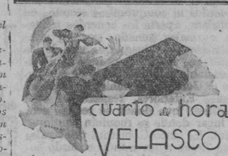
Programa que transmitirá Radio Segovia mañana sábado, de once y cuarto a once y media de la noche, organizado por la Perfumería Velasco:

Reconocimiento médico, asistencia facultativa en el parto, ajuste sanitario, asistencia en los dispensarios de la Obra Maternal e Infantil (la madre y el hijo), internamiento en maternidades del Seguro, premio a la lactancia, premio por descanso (las asalariadas)