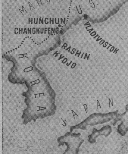
Gráfico del teatro inicial de las operaciones rusas contra el Japón, con el Manchukuo y Corea como inmediatos objetivos

Londres, 10.—Según las fuentes británicas de información generalmente fidedignas, comunica la Agencia United Press, la demanda japonesa de que sea respetada la soberanía del Emperador no impedirá a Gran Bretaña aceptar la rendición japonesa.—Efe.