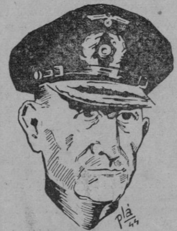
El gran almirante Doenitz, de quien dicen los aliados que, secundando la ofensiva de von Rundstedt, ha emprendido operaciones navales dirigidas a desorganizar los suministros aliados, por mar, a las fuerzas de tierra en Europa