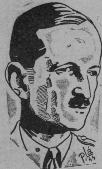
El general Leclerc, jefe de las fuerzas francesas que operan en el sector Sur del frente occidental, en las tierras de Lorena, por la total liberación de Francia.