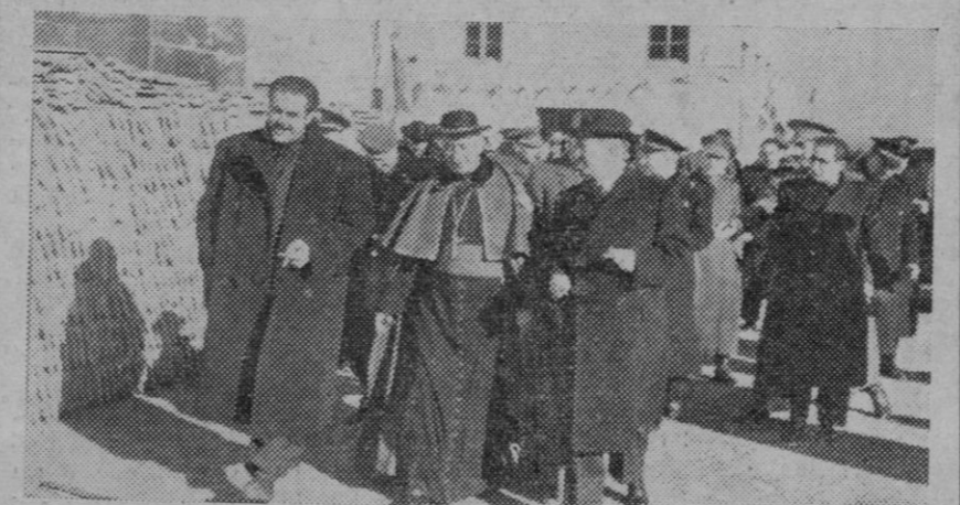
El ministro de Trabajo, señor Girón, con otras autoridades y jerarquías nacionales, a la salida de los Comedores de obreros ferroviarios inaugurados en Villaverde (Madrid)

Así acaba de anunciarlo el delegado nacional de Sindicatos