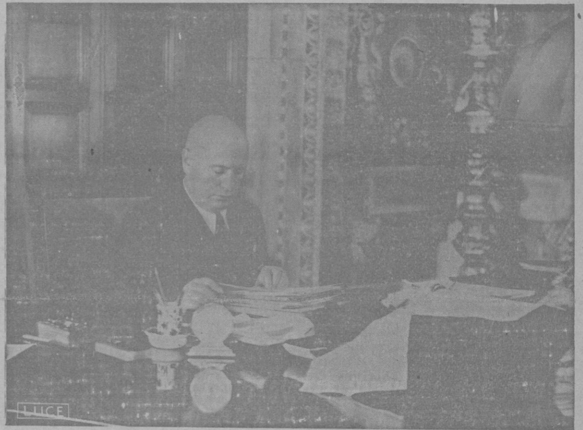
El DUCE en su mesa de trabajo del Salón del Mapamundi del Palacio Venecia (Prohibida la reproducción)

Así como en los anales de la historia se destacan los grandes hechos, cual las siluetas de las cumbres, también en estas etapas que marcan los hitos de la humanidad, se revelan los grandes hombres.