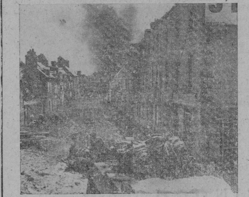
Aspecto de una ciudad francesa al ser ocupada por los aliados

París, 7 (5 t.).—Después de forzar otro paso en los Vosgos, el primer Ejército francés ha llegado a las afueras de Munster, 14 kilómetros al Oeste de Colmar, según anuncia Radio París.—Efe.