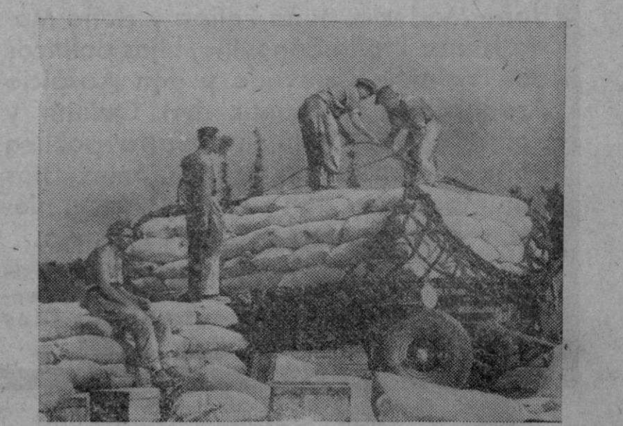
Soldados aliados descargando alimentos enviados a la población parisiña por la Gran Bretaña