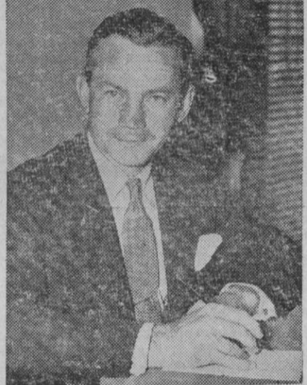
James V. Forrestal, que ha sido nombrado ministro de Marina de los Estados Unidos, en sustitución del coronel Knox, recientemente fallecido.