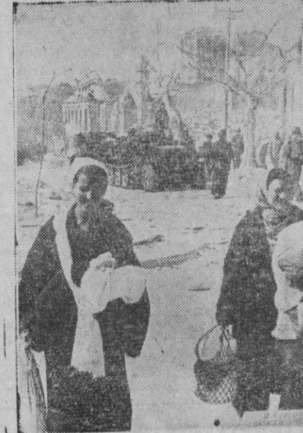
Una de las últimas fotografías de un sector de Sebastopol, antes de ser evacuada la ciudad por los alemanes. Al fondo se ve un camión alemán delante de un edificio en ruinas. En primer plano, dos mujeres rusas que se alejan de la zona de peligro.

En el sector inmediato al Sur del Dniéster superior, una región forestal ha sido limpiada de los grupos soviéticos dispersos, y las posiciones alemanas han sido avanzadas hacia el Sur.