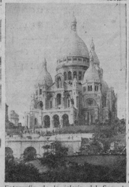
Fotografía de la iglesia del Sagrado Corazón, situada en el punto más elevado de París, en Montmartre, que ha resultado gravemente alcanzada por las bombas durante los últimos ataques aéreos.