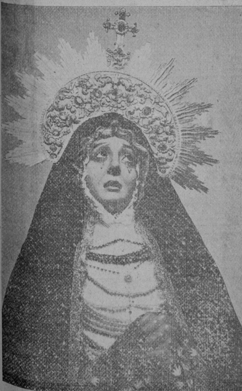
Imagen de Soledad Dolorosa, venerada en la iglesia de Santa Eulalia. Impresiona el realismo de sus divinas facciones que parecen reflejar el instante en que los dolores de su corazón maternal fueron más acerbos