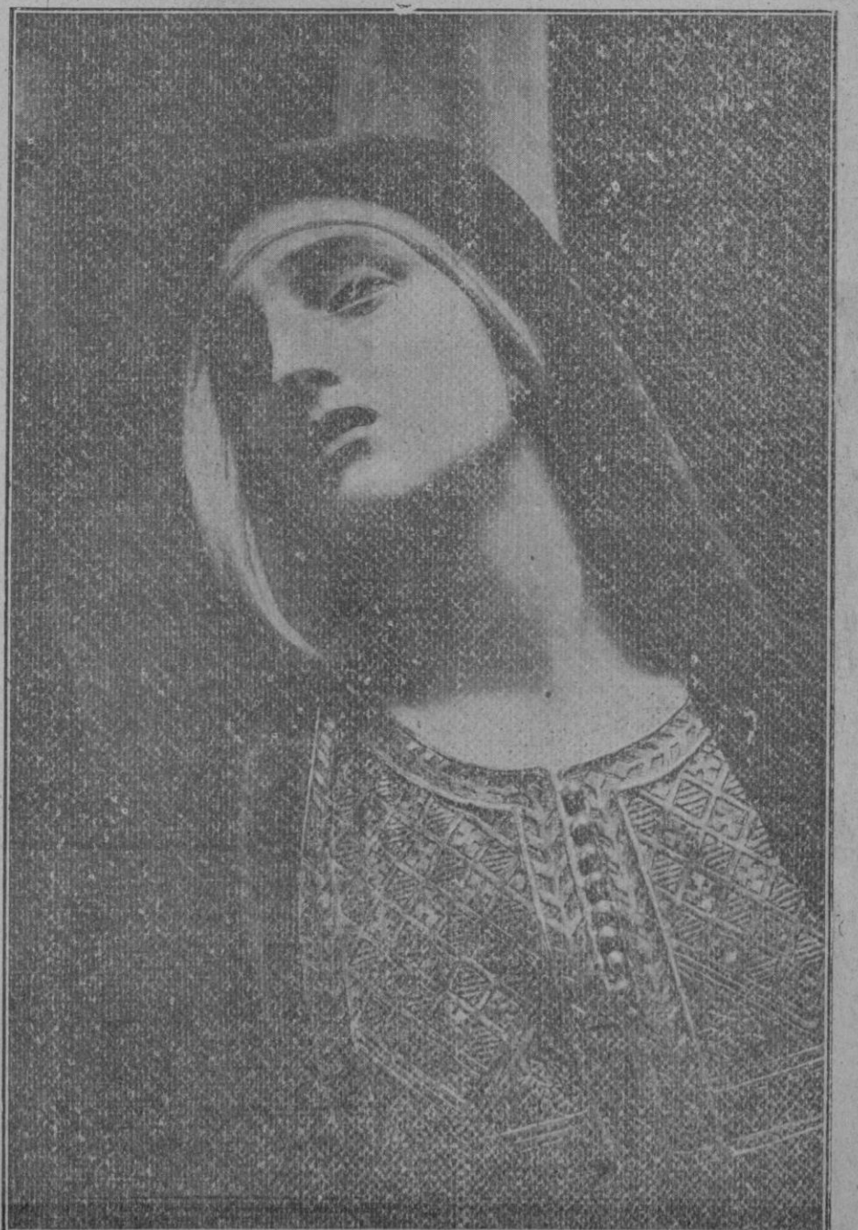
«La Soledad al pie de la cruz», soberbia talla del insigne escultor segoviano don Aniceto Marinas, que se venera en la iglesia de San Millán y sale en la procesión del Viernes Santo