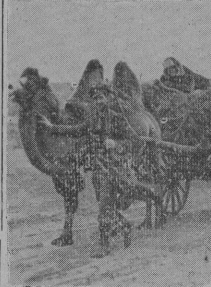
Las tropas alemanas utilizan muchas veces como medio de transporte, en el Sur del frente del Este, resguardados camellos

truidos. Nuestra artillería pesada y baterías de morteros han destruido nuevas posiciones de partidas enemigas. Del 3 al 5 de Abril, los soviets han perdido 117 aviones destruidos en combates aéreos o por la D. C. A. Comunicado rumano. Ganancias de terreno Bucarest, 6 (5 t.).—El alto mando rumano comunica: Sin novedades dignas de mención en Crimea, costa del mar Negro y Besarabia central. A pesar de la encarnizada resistencia del enemigo, ha ganado terreno un contraataque de nuestras tropas al Norte de Ressay. Han sido conquistados una altura y varios pueblos e infligidas elevadas pérdidas al adversario. Al Norte de Cernauti se desarrolla con éxito un ataque alemán contra las líneas de comunicación del enemigo, que ha irrumpido en Bucovina septentrional y en Moldavia.—Efe.