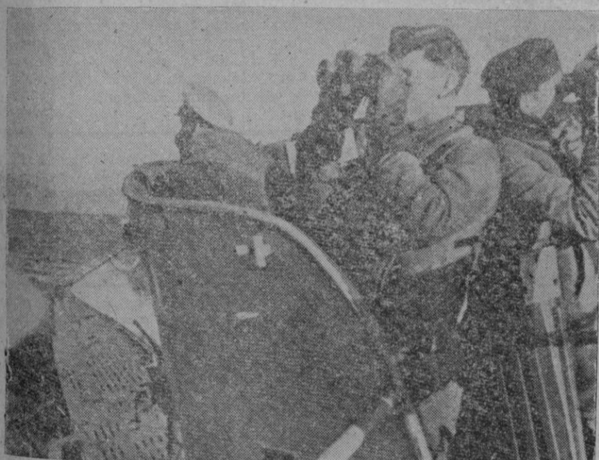
Desde la torreta de un submarino alemán, en el Mar Negro, es observado el horizonte en busca de barcos enemigos

En el Beresina y Rogachef continúan los fuertes combates