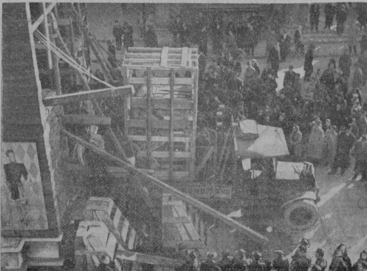
Un famoso monumento de Milán, que amenazado por los violentos bombardeos aliados que han reducido a ruinas media población, es retirado de su provisional protección de madera y sacos terrosos, para ser trasladado a lugar más seguro