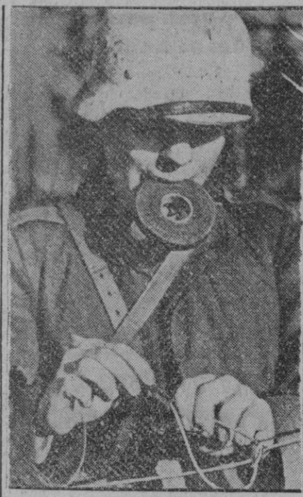
Un soldado de Transmisiones del Ejército alemán repara rápidamente una avería causada por el enemigo en la línea telefónica

Ciertamente que en los últimos días la actuación de la aviación había adquirido una intensidad verdaderamente extraordinaria, batiendo objetivos enormemente separados de sus bases y sufriendo un desgaste, sobre todo en el cielo alemán, que forzosamente ha de dejarse sentir. La cifra de 61