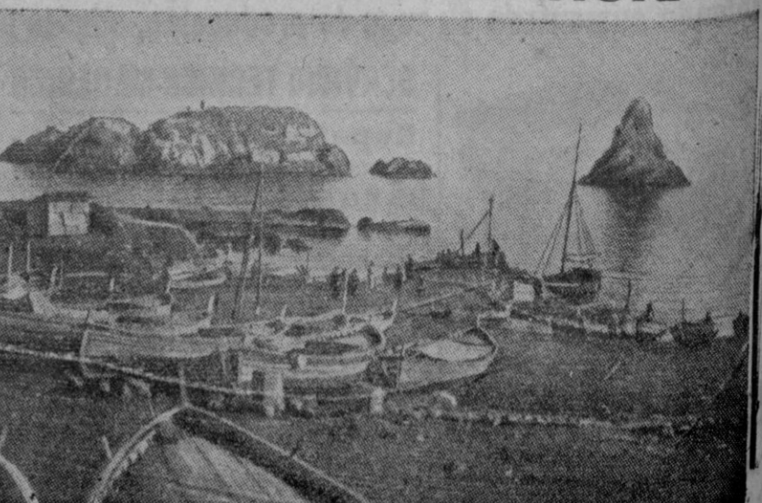
Al mismo tiempo que el octavo Ejército ataca en dirección a Catania, la flota de guerra cañonea la costa hasta Mesina. En la foto vemos una vista de la pintoresca villa de Acitrezza, situada al pie del Etna, al Norte de Catania