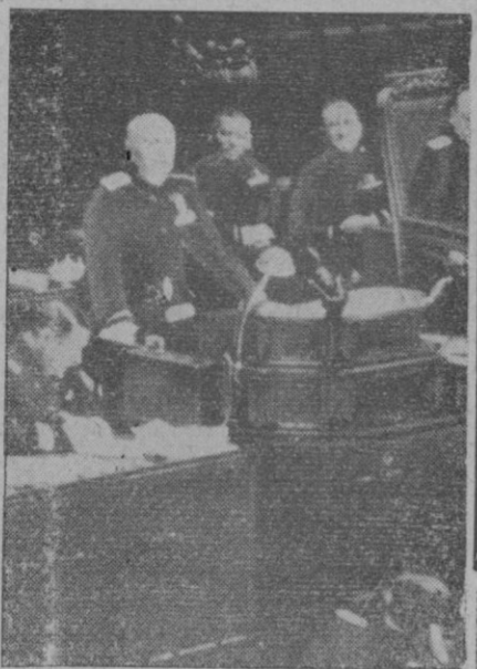
El Duce durante un discurso pronunciado por él ante la Cámara del Fascio de los extranjeros indeseables, Mussolini declaró que de 110.000 gran parte de ellos han regresado a sus patrias, y otros han sido internados en campos de concentración.