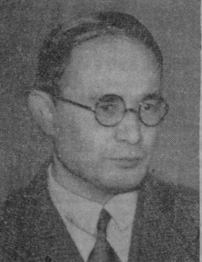
Namoru Shigemitsu, nuevo ministro japonés de Asuntos Exteriores