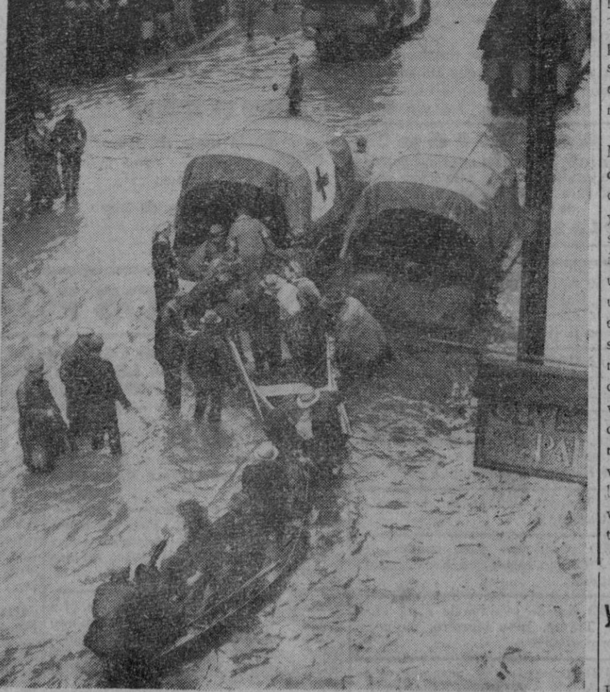
Los grandes ríos Mississippi y Missouri se han desbordado y han inundado dilatadas regiones, causando daños que se calculan en treinta millones de dólares. La fotografía nos muestra el aspecto que ofrece una calle de una ciudad inundada.