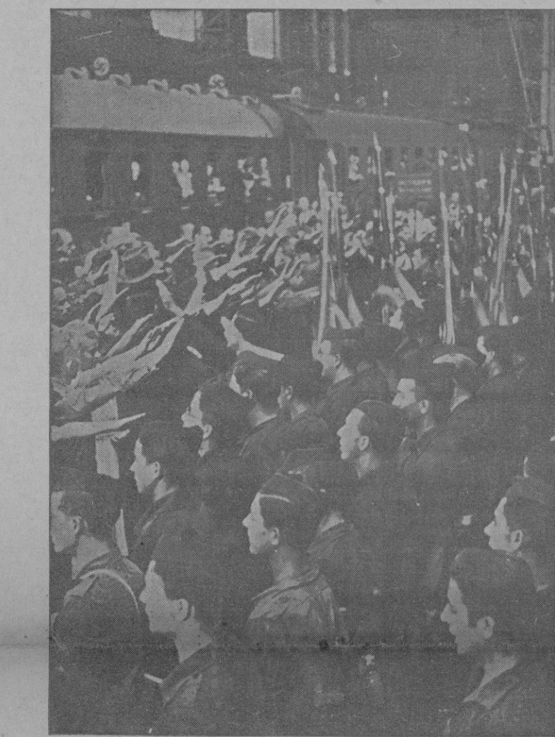
Los Flechas y Cadetes de la Falange que visitan Alemania por invitación de la Juventud Hitleriana, están formados en una de las estaciones de Berlín esperando la llegada del tren que ha de llevarles a Nuremberg.

Zaragoza.—Los diarios locales recogen dos episodios heroicos que tuvieron como escenario diversos puntos del frente aragonés. Durante la pasada ofensiva marxista que terminó con el tremendo desastre para los rojos, donde tuvo lugar la gesta heroica escrita por los muchachos ascritos al Tercio de Requetés de la Virgen de Montserrat en la defensa maravillosa del pueblo de Codos, el que estaba entregado a 180 Requetés catalanes que durante más de 40 horas estuvieron en su puesto manteniendo en jaque a 8 o a 10.000 hombres con todo lujo de armas automáticas, cañones, morteros y caballería, docenas de tanques rusos se echaron sobre esta pequeña posición en la madrugada del 24 de Agosto. Eran estos muchachos trabajadores de todos los oficios y al estallar el movimiento corrieron a defender la bandera roja y gualda. Para ello tuvieron que atravesar la arboleda y el adusto paisaje de Lérida y traspasando montes y saltando muros llegaron a nuestra zona pidiendo un puesto de combate en los puestos avanzados. El Mando dispuso enviarlos a Mediana de Aragón, luego a Codos a 4 kilómetros de Belchite. Sus armas, mosquetones, dos ametralladoras y algunos fusiles ametralladoras y un puñado de granadas de mano.