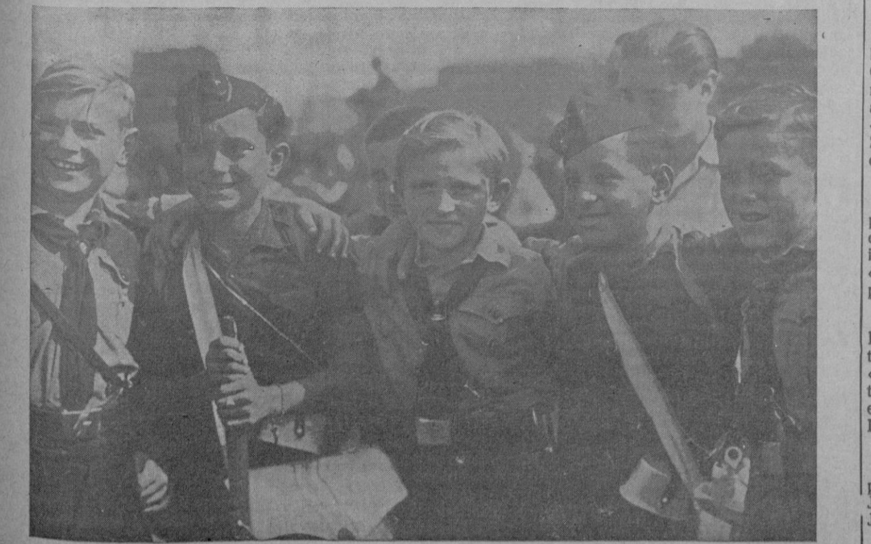
¡Buenos amigos! Muchachos de la Juventud Hitleriana y Flechas de la Falange que visitan Alemania invitados por las Organizaciones Juveniles del Reich.