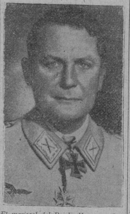
El mariscal del Reich, Hermann Goering, jefe supremo de la aviación alemana

El X aniversario de la creación del Arma Una orden del día del mariscal Goering