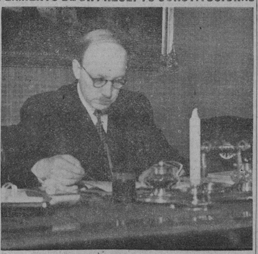
El Presidente de Finlandia, Risto Ryti, que hoy ha asumido la primera magistratura de la nación por dos años más

Helsinki, 2 (2 t.).—El Gobierno finlandés, en cumplimiento de un precepto constitucional, ha presentado la dimisión colectiva. Las gestiones para constituir nuevo Gobierno han adquirido mayor volumen que en días precedentes. Se sabe que el grupo social democrata del Parlamento ha decidido dar su apoyo a la candidatura de Reinika, director del Banco Nacional, para la presidencia del Consejo