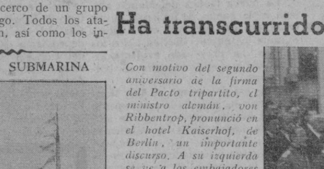
Un submarino alemán vuelve a su base trayendo como trofeo la bandera de un mercante norteamericano. Al ser torpedeado el buque, la bandera cayó en la cubierta del sumergible.

Un submarino alemán vuelve a su base trayendo como trofeo la bandera de un mercante norteamericano.