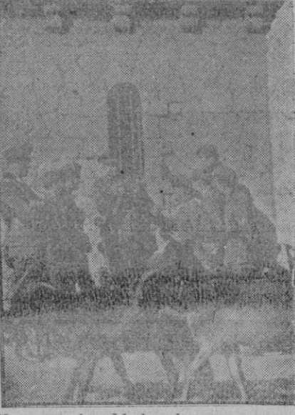
Un grupo de soldados alemanes en conversación con un soldado español