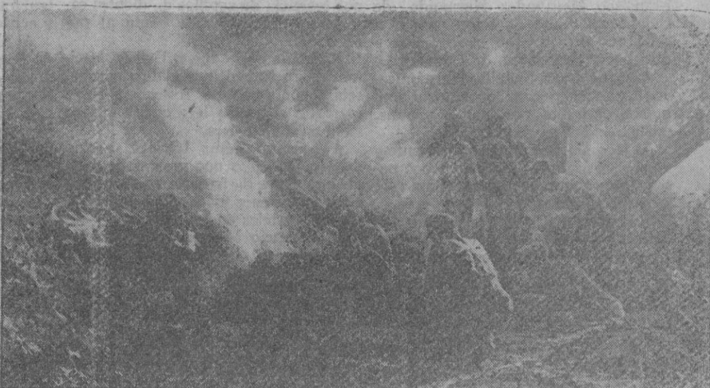
CAZADORES ALEMANOS DE MONTAÑA EN LOS MONTES DEL CAUCASO.—Como la cocina de campaña no puede transportarse por las montañas, se preparan ellos mismos el rancho en los utensilios que llevan consigo

servía de punto de concentración a las tropas rojas, ha sido eficazmente bombardeado por los aviones alemanos, pese a las malas condiciones atmosféricas, en el sector central del frente oriental. Además, un avión alemán ha hundido un mercante soviético de 7.000 toneladas en el Océano Glacial Arctico. Otros buques fueron averiados por la aviación del Reich en las mismas aguas.—Efe. La lucha en Stalingrado Berlín, 5 (5 t.)—Los destacamentos de choque alemanos han limpiado un núcleo de resistencia soviético en el interior de Stalingrado. Todos los contraataques bolcheviques han sido rechazados. Un mercante de gran desplazamiento que navegaba en el Volga, ha sido hundido por un disparo de artillería. Un cañonero soviético ha sido hundido al Norte de Stalingrado por las baterías de la D. C. A. alemana. La aviación alemana ha bombardeado intensamente las vías de comunicación bolcheviques al Este del Volga.—Efe.