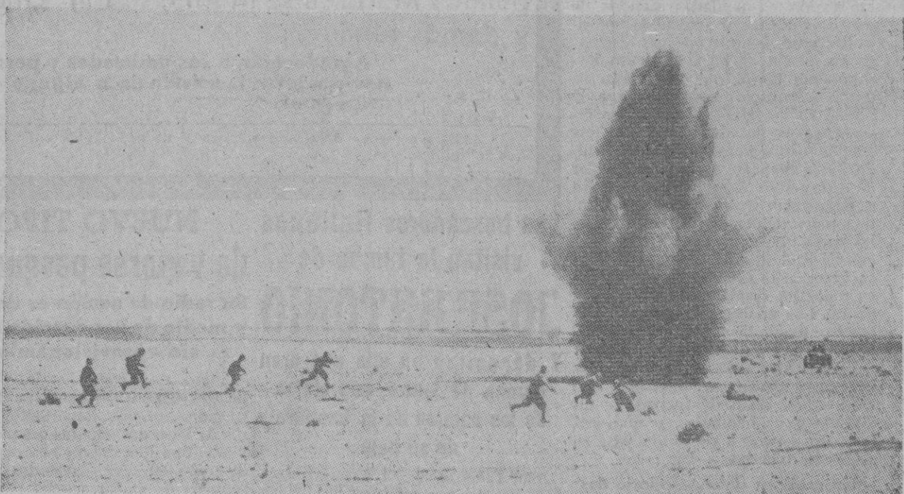
LA GUERRA EN EL FRENTE EGIPCIO.—La fotografía reproduce el momento de la explosión de un obús de la artillería inglesa delante de una patrulla italiana en misión de reconocimiento.

Se libran sangrientos combates entre tropas de Infantería y unidades de carros de asalto Los GERMANO-ITALIANOS se sostienen aún en posiciones al Sur del frente