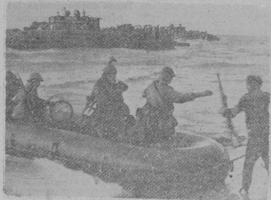
Después de muy duros combates, fué conquistada por las tropas alemanas y rumanas la península de Taman. La fotografía muestra tropas rumanas en el momento de acercarse a tierra con sus botes neumáticos.

Comunicado alemán Berlín, 25 (2 t.).—Comunicado del alto mando de las fuerzas armadas alemanas: En la región del Cáucaso las tropas alemanas y aliadas han efectuado nuevos avances después de ocupar posiciones enemigas encarnizadamente defendidas y de rechazados contraataques. En la lucha contra los objetivos navales de la costa caucásica, nuestra aviación ha averiado gravemente a dos barcos mercantes que fueron alcanzados de lleno por las bombas. En la zona de Stalingrado nuestras fuerzas han conquistado nuevas bases fortificadas tras una tenaz lucha en las casas.