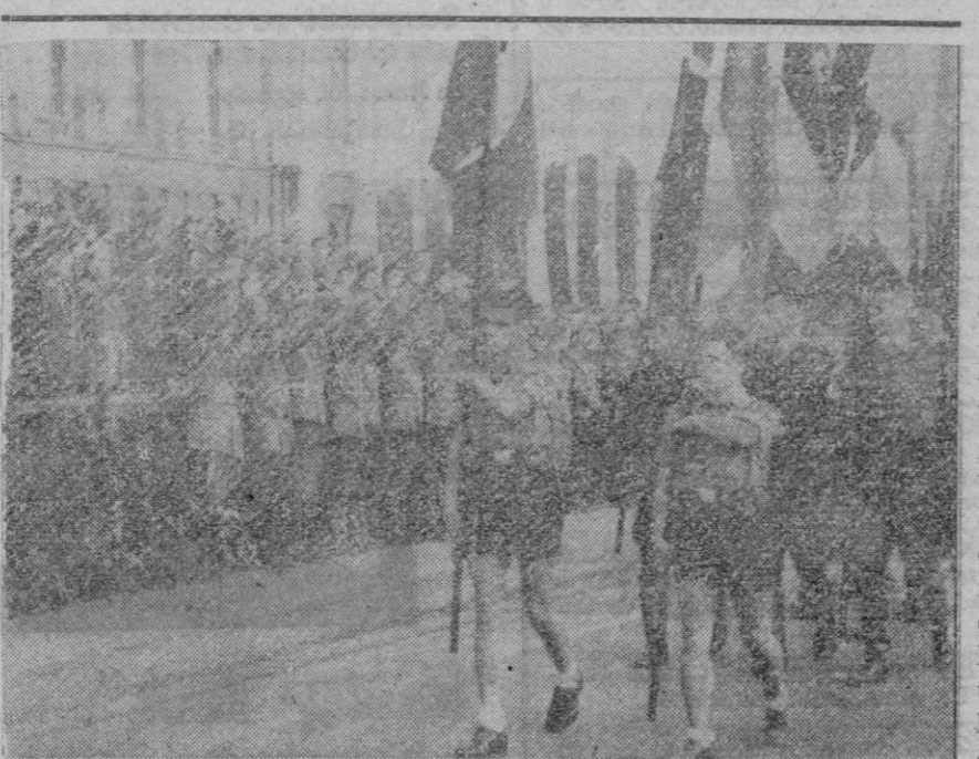
De los actos celebrados en Viena con motivo de la fundación de la Unión de Juventudes europeas. La juventud húngara desfila ante los jefes de las juventudes europeas.