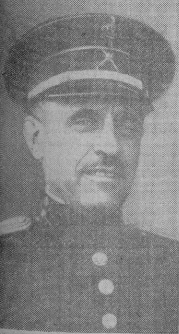
El conde de Jordana, ministro español de Asuntos Exteriores

España y Portugal, vecinos de puerta y ventana, pese a lo cual vivieron mucho tiempo en un ambiente de mutua desconfianza, vuelven de espaldas, mirándose cara a cara el día en que la espiritualidad española se alzó contra el bolchevismo, y advirtieron el peligro y decidieron hablarse de ventana a ven-