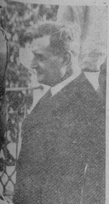
Salazar, jefe del Gobierno portugués

ana, como buenos amigos, más amigos—como ha dicho Oliveira Salazar—por ser independientes y celosos de nuestra autonomía. En este ambiente surgió el Pacto de amistad que en el transcurso del tiempo va fortaleciéndose y creando el sentimiento de confianza sincera a que aludía ayer el jefe del Gobierno portugués en su telegrama al ministro de Asuntos Exteriores de España, y confirmada en la afectuosísima contestación del conde de Jordana.