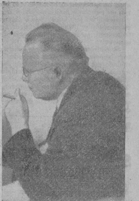
Litvinof, embajador soviético en Washington

LITVINOF ha planteado una demanda urgente