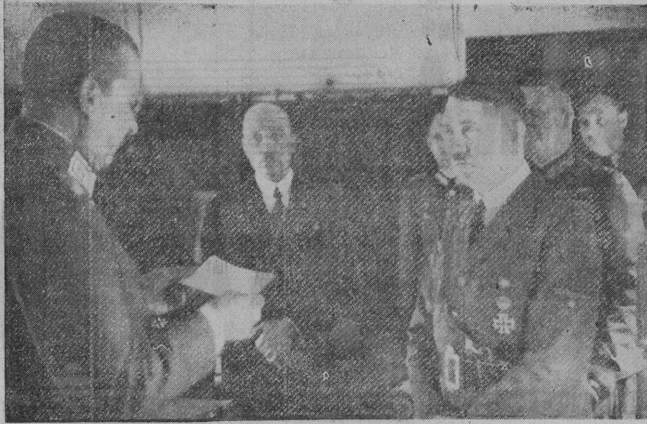
LA VISITA DE ADOLFO HITLER A FINLANDIA.—Recientemente el Canciller de Alemania estuvo en Finlandia, con objeto de visitar y felicitar al mariscal Mannerheim con motivo del cumpleaños de éste. Venios en la foto, a la izquierda, al mariscal finlandés; en el centro, el Presidente de Finlandia, señor Rytty; en primer plano, a la derecha, el Führer, y detrás de éste el mariscal alemán Keitel.

Las fuerzas germano-rumanas han alcanzado nuevos éxitos