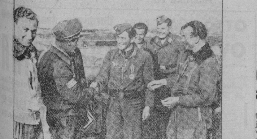
El más joven aviador de una escuadrilla alemana ha derribado su primer avión enemigo, después de su veintidésimo vuelo sobre Malta. Con este motivo le ha sido concedida la Cruz de Hierro. Los compañeros de su escuadrilla le felicitan por su victoria.

Roma, 28 (2 t.).—Comunicado número 66 del alto mando de las fuerzas armadas italianas: Algunos avances de los elementos blindados enemigos han sido rechazados por el intenso fuego de nuestra artillería en Cirenaica, donde la actividad de la aviación de reconocimiento se ha incrementado durante las últimas veinti-