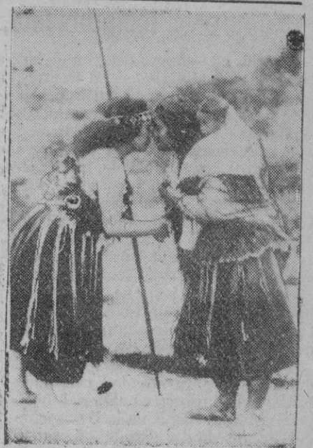
COSTUMBRES DE LOS NEOZELANDESES.—Los habitantes de Nueva Zelanda conservan muchas de sus primitivas costumbres. Por ejemplo, la de saludarse con un apretón de manos y frotándose las narices como las dos mujeres que vemos en el grabado

Del mismo modo pueden señalarse reacciones favorables en ciertos elementos que practican la ocultación de productos para conseguir cotizaciones exageradas al amparo de la escasez provocada por ese incivil procedimiento de dejar desabastecido el mercado. Esto no quiere decir que caminamos ya francamente por el camino que conduce a la normalidad. Solamente está marcado el derrotero, la orientación. Es preciso seguir ade-