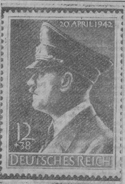
Con ocasión del aniversario del nacimiento del Führer, celebrado el 20 de Abril, el departamento alemán de Correos ha emitido el sello que reproduce este grabado, como homenaje al Canciller. El citado sello se venderá hasta el mes de Junio próximo, y los ingresos conseguidos con la venta del mismo se destinarán a fomentar la cultura alemana.

Londres, 28 (5 t.)—Comunicado del ministerio del Aire: «Durante la noche pasada, con tiempo claro, una gran formación de bombarderos ha atacado los objetivos de Colonia y la región renana; los objetivos fueron fácilmente distinguidos y se provocaron grandes incendios. Otra gran formación bombardeó la base naval alemana del fiord de Trondheim. Los resultados de este ataque no serán conocidos antes de algún tiempo. Los muelles de Dunquerque y los aeródromos y territorios ocupados por el enemigo fueron igualmente bombardeados. Se sembraron minas en aguas adversarias. De todas estas operaciones no han regresado diecisiete aparatos. Un avión «Hudson», del servicio costero, atacó y averió a un buque enemigo frente a la costa de Dinamarca. Un reconocimiento practicado ahora, ha permitido comprobar que en el reciente ataque contra Rostock, los principales talleres de las fábricas de aviones Heinkel, así como numerosos edificios auxiliares, resultaron dañados. Los incendios de Rostock continuaban todavía a mediodía del lunes».—Efe.