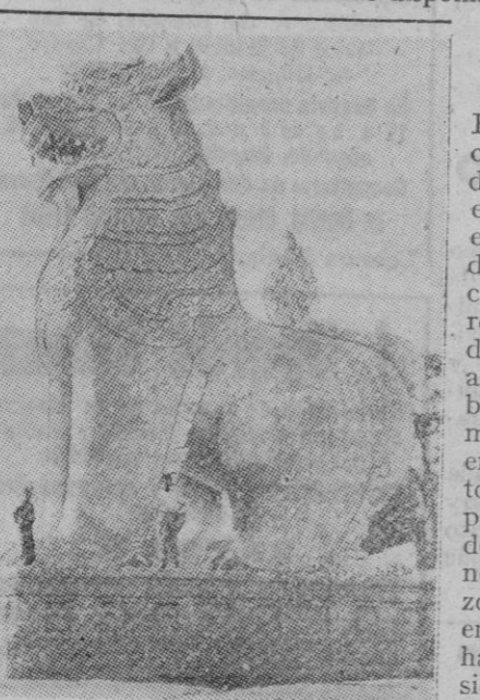
UN CENTINELA DE MANDALAY. En Mandalay, antigua capital de Birmania, hacia la cual avanzan los japoneses, hay gran número de templos, pagodas y estatuas, que son una espléndida muestra del arte arquitectónico birmano. En el grabado vemos uno de los leones gigantes que están contruidos con ladrillo, al pie de la colina de Mandalay. Como puede verse, el pie del del león tiene la altura de un hombre

Nueva York, 27 (5 t.).—En sus comentarios al discurso del Führer, el periódico «New York Times» afirma que «cualquiera que sean las consecuencias que se quieran sacar de él y el consejo que se pueda derivar de sus últimas confesiones o de las omisiones hechas por Hitler, Norteamérica y sus aliados no pueden hacerse ilusiones. No es ahora cuestión de saber —añade— si las fuerzas militares a disposición de Hitler son más débiles o más potentes. La única política recomendable a las naciones aliadas es la de actuar con todas las fuerzas disponibles.»—Efe.