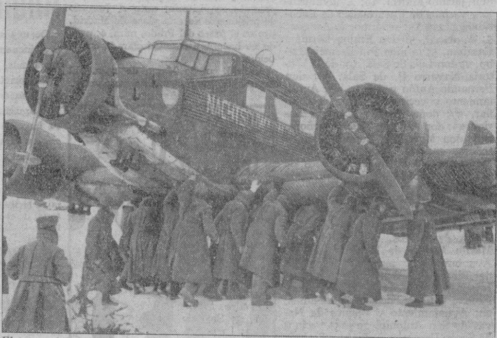
El personal de tierra de un aeródromo alemán prepara para el despegue un gran avión de transporte, que llevará abastecimientos para las posiciones avanzadas del frente Este.

En la costa del Cáucaso, los aviones alemanes han bombardeado fuertemente de día y de noche diversas