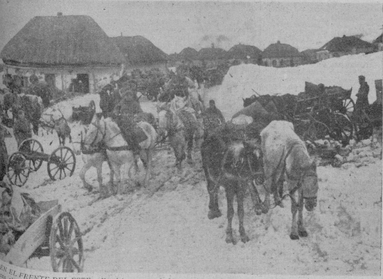
EN EL FRENTE DEL ESTE.—En el transcurso de los grandes combates librados en la región del Donetz, las fuerzas alemanas de aprovisionamiento han tropezado con grandes dificultades para llevar material y víveres al frente. La fotografía parte de un convoy de tracción animal, sistema que ha sido forzoso utilizar en gran escala en el frente del Este a causa del intenso frío y de los hielos que han obligado a restringir al máximo la circulación de los vehículos de motor.

Si has cumplido los sesenta y cinco años, visita la Obra Sindical de Previsión Social para que gestiones sin remuneración alguna tu pensión de vejez.