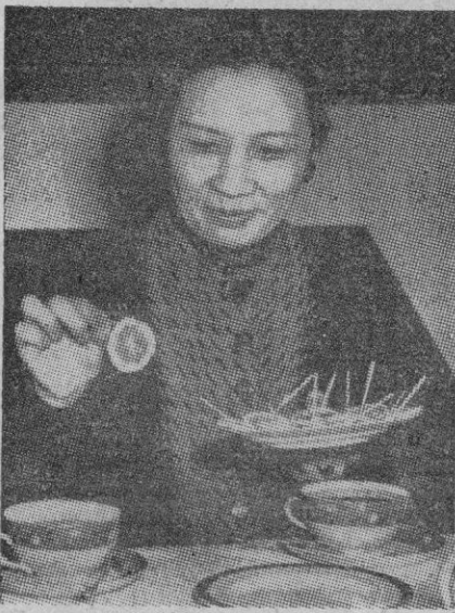
La esposa de Chang-Kai-Chek, a quien vemos en la fotografía tomando una taza de té, trabaja incansablemente al lado de su marido en los asuntos políticos y militares