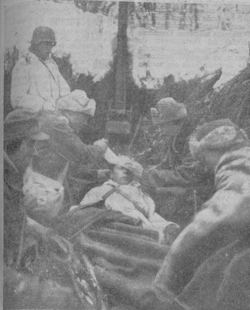
LA GUERRA EN EL ESTE.—Un soldado finlandés herido, es curado en un puesto de socorro instalado en las proximidades de la línea de fuego

La Prensa inglesa señala grandes preparativos germanos para atacar en Oriente Medio