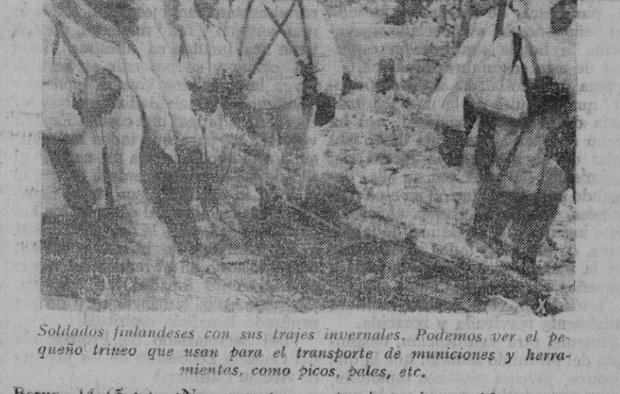
Soldados finlandeses con sus trajes invernales. Podemos ver el pequeño trineo que usan para el transporte de municiones y herramientas, como picos, palas, etc.

La isla se encuentra poderosamente fortificada