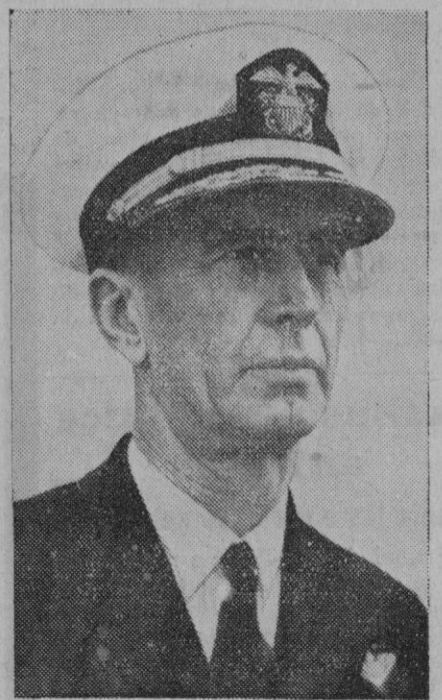
El almirante Ernesto King, que hasta ahora había sido jefe de la flota atlántica americana, ha sido nombrado jefe supremo de la escuadra. Desempeñará su cargo en el Atlántico y en el Pacífico

Tokio, 14 (2 t.).—El Cuartel general imperial comunica que los aviones japoneses de bombardeo han atacado el aeródromo de Mingalodón, cerca de Rangun, donde han destruido por lo menos dos aviones británicos que se encontraban en la pista de