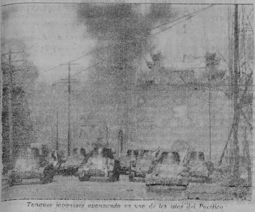
Tanques japoneses avanzando en una de las islas del Pacífico

Dominio completo nipón del Estado de Pahang Actualmente se encuentra cerca del Estado de Johore