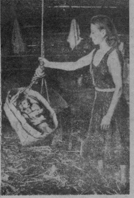
Los rusos, al retornar a sus hogares bajo el amparo de las armas alemanas, suelen encontrarlos deshechos, saqueados o quemados. Hay que habilitar, de la mejor manera posible, una habitación. En la foto vemos a una mujer rusa que, con su hijo recién nacido, se dispone a tomar posesión de su antiguo hogar. Hay que trabajar de firme y, para ello, el pequeño no debe ser un obstáculo. Se le deposita en una cunita provisional, queda ésta suspendida del techo, y... ¡manos a la obra!

Berlín, 26 (2 t.).—Más de 1.000 carros de combate y automóviles blindados han destruido las fuerzas alemanas e italianas en Cirenaica desde el 9 al 20 de Diciembre, según anuncia la radio alemana.—Efe.