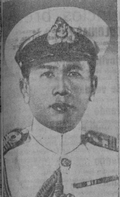
El mariscal Songgram, el "hombre de hierro" de Thailandia que reina, de hecho, en el país, como tutor del Rey niño Ananda Mahidol

Declaraciones del primer ministro thailandés Los países del Asia oriental deben dejar de luchar entre sí