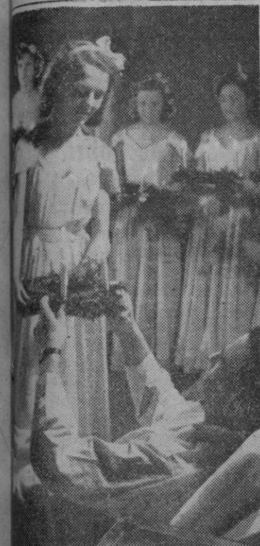
En los hospitales alemanes, los soldados heridos o enfermos son obsequiados con regalos por señoritas que, como en el caso de enseñanza, se acercan a los lechos de los pacientes.