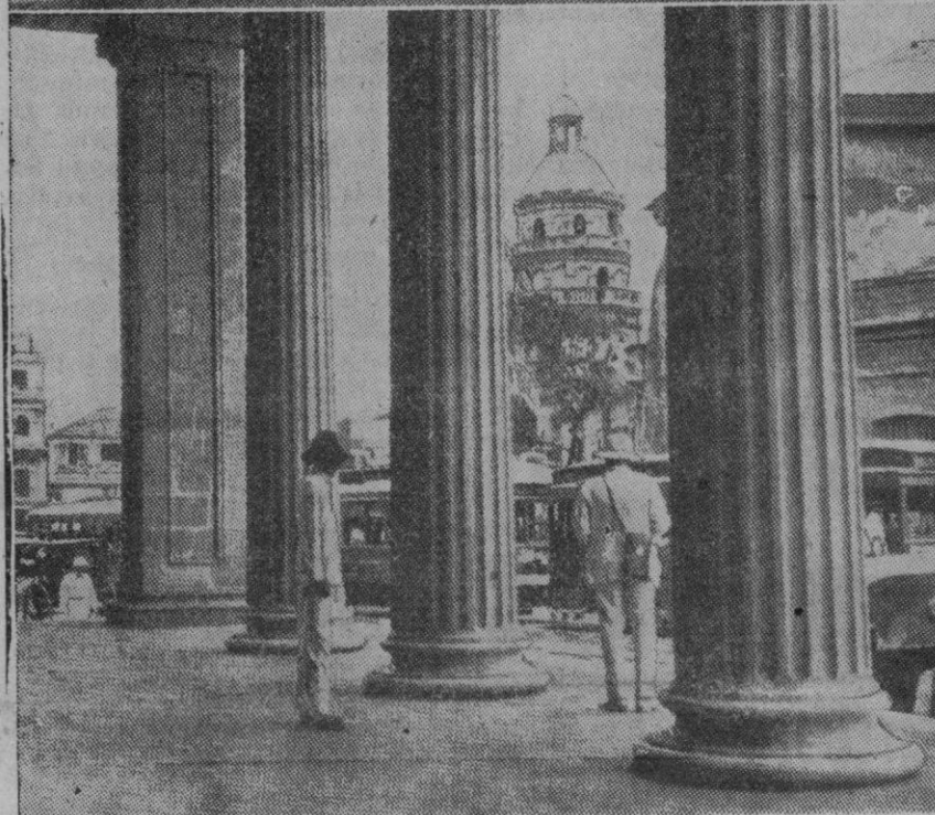
LA GUERRA EN FILIPINAS.—Los objetivos militares de Manila son objeto frecuentemente de los ataques aéreos de la aviación japonesa desde que estalló la guerra en el Pacífico. En la fotografía superior vemos una vista del palacio del Gobierno en la capital de Filipinas, y abajo, otra de la cúpula de la iglesia de Santa Cruz por entre las columnas del gran edificio en el que se halla instalado el Monte de Piedad, institución de caridad que funciona bajo el control gubernamental y que, como su nombre indica, tiene por objeto prestar cantidades en metálico con la garantía de bienes muebles, especialmente prendas, mediante un módico interés. Al parecer, Manila será declarada ciudad abierta.