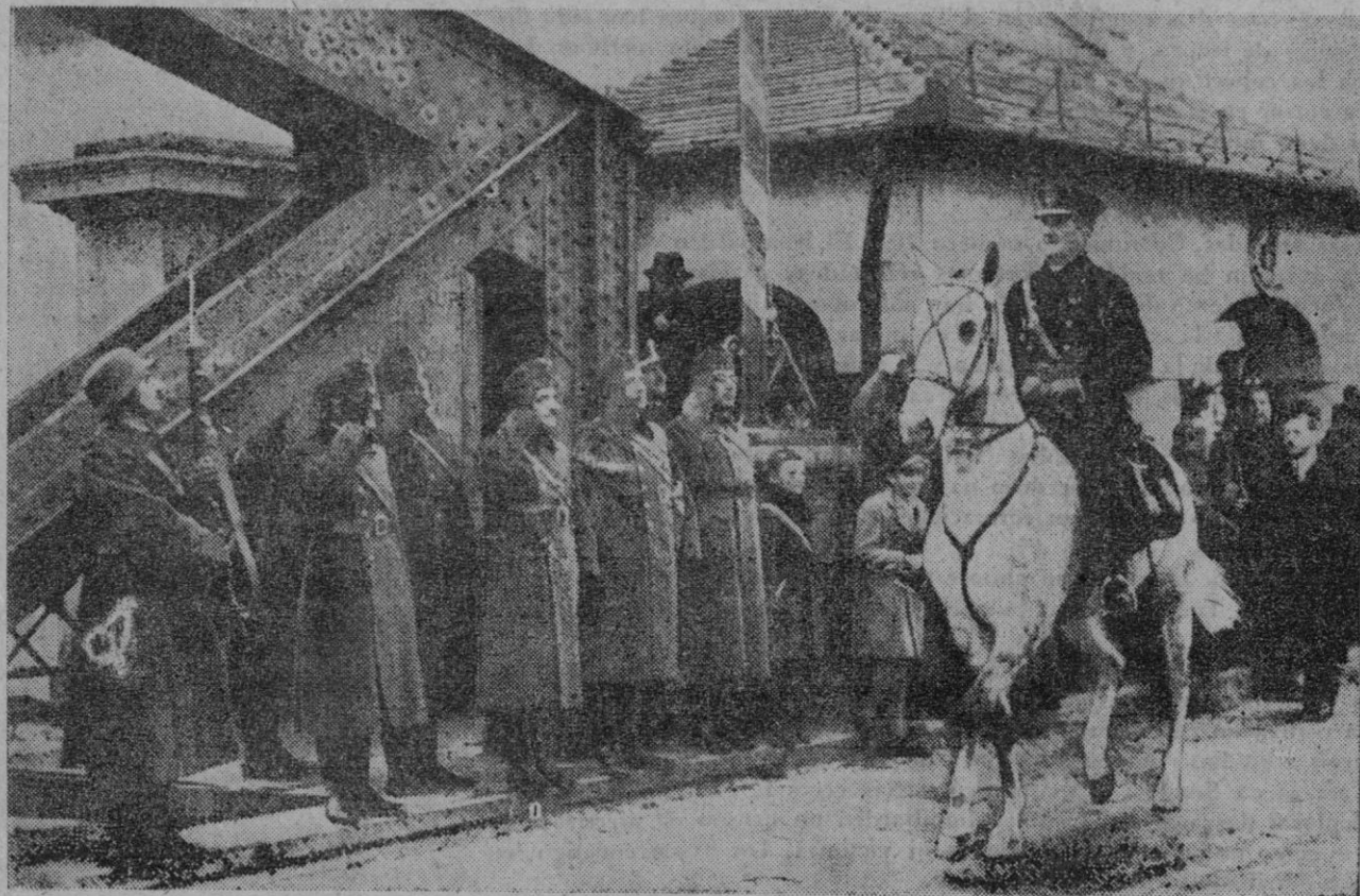
El regente Horthy, de Hungría, entrando, a la cabeza de sus tropas, en una de las ciudades de Transilvania devueltas por Rumania

Y les señala la conducta a seguir en la presente época, dura para Rumania